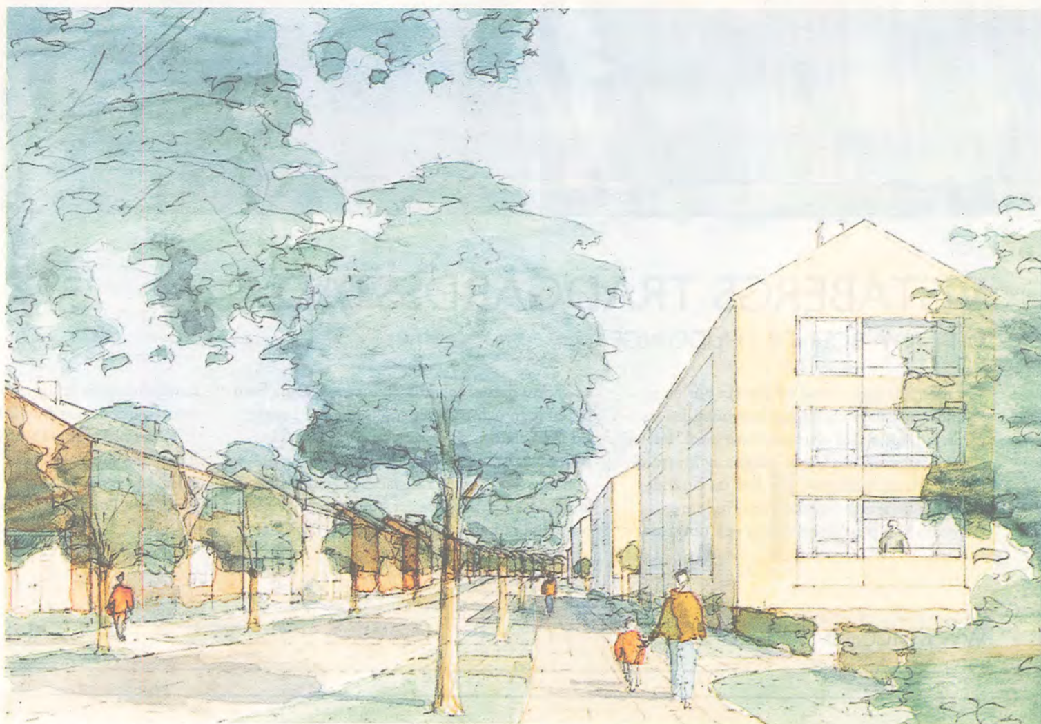
Vid Vistabergs Allé är det trädgårdsstadens principer som gäller. Sammanhållna gaturum i två till tre våningars höjd och trädgårdar på husens privata sidor avskilda från gatan. Illustration från Södergruppen arkitektkontor.

Efter nästan ett sekel gör trädgårdsstaden come back. I Vistaberg i Huddinge planeras ett helt bostadsområde som bygger på ett hundraårigt småstadsideal.