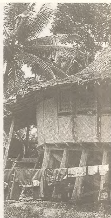
Familjehus i Bawödesölö på Nias.