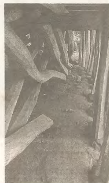
Typisk konstruktion för hus på Nias.