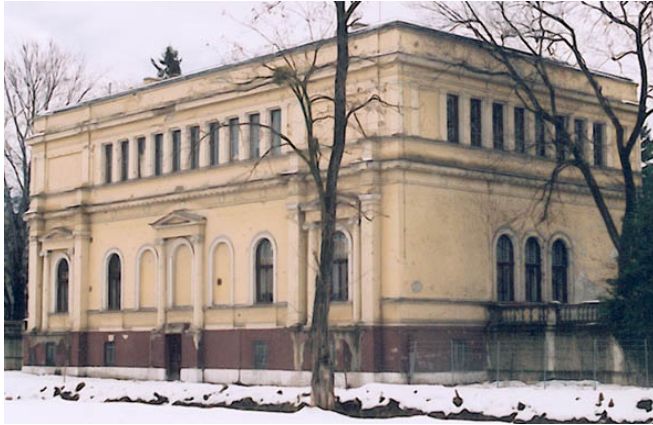
Bibliotekspaviljongen i januari 2003. Restaureringsarbetena påbörjades några månader senare.

Under våren 2003 påbörjades det exteriöra restaureringsarbetet av den paviljong som numera upptas av museets bibliotek. Arbetet genomförs som ett samarbete med Bosnien och Hercegovinas kulturarvsinstitut i Sarajevo och finansieras av Sida. Restaureringen utförs efter samma metoder som den naturhistoriska- och arkeologiska paviljongen.